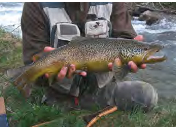
Trotta Marmorata... la regina delle acqua solandre