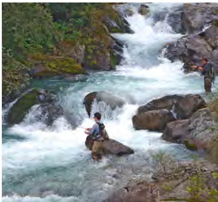
Torrente Vermigliana - zona NK3