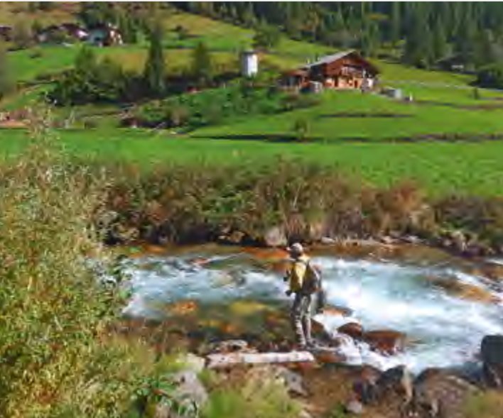
Torrente Rabbies - Riserva "Le Marinolde"

Circondata da spettacolari gruppi montuosi, Adamello Presanella, Ortles Cevedale, Dolomiti di Brenta e Madalene, la Val di Sole è un territorio di rara bellezza e permette al pescatore di ammirare uno splendido panorama e nello stesso tempo di godersi acque particolarmente pescose con più di 120 km di fiumi e torrenti e 12 laghi alpini popolati da trote Marmorate, Fario e Salmerini.