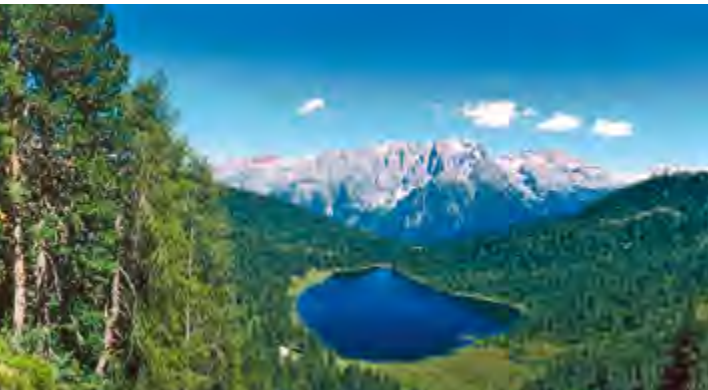
Lago delle Malghette

Circondata da spettacolari gruppi montuosi, Adamello Presanella, Ortles Cevedale, Dolomiti di Brenta e Madalene, la Val di Sole è un territorio di rara bellezza e permette al pescatore di ammirare uno splendido panorama e nello stesso tempo di godersi acque particolarmente pescose con più di 120 km di fiumi e torrenti e 12 laghi alpini popolati da trote Marmorate, Fario e Salmerini.